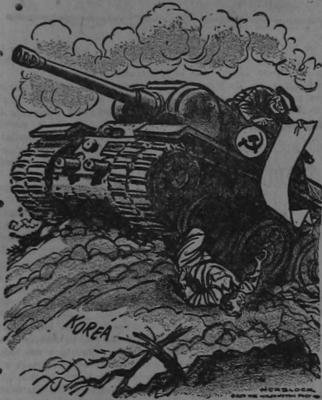
EL QUE LA DEBE, LA TEME...

Con esta leyenda, "The Washington Post", uno de los principales periódicos de los Estados Unidos, publicó recientemente esta caricatura.